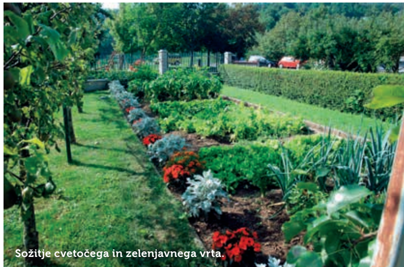
Sožitje cvetočega in zelenjavnega vrta.