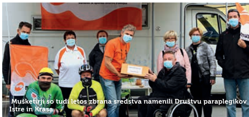
Mušketirji so tudi letos zbrana sredstva namenili Društvu paraplegikov Istre in Krasa.