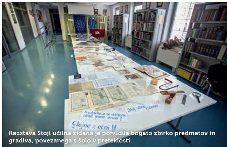
Razstava Stoji učilna zidana je ponudila bogato zbirko predmetov in gradiva, povezanega s šolo v preteklosti.