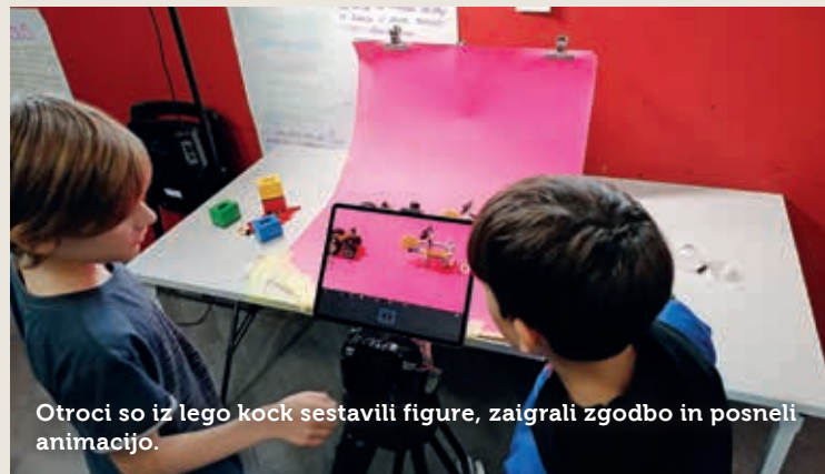
Otroci so iz lego kock sestavili figure, zaigrali zgodbo in posneli animacijo.

Teden otroka je v Postojno prinesel dve delavnici. Otroci so se lahko preizkusili v izdelovanju senčnih lutk in izvedbi pravljice ter sestavljali figuro iz lego kock; te so nato tudi animirali.