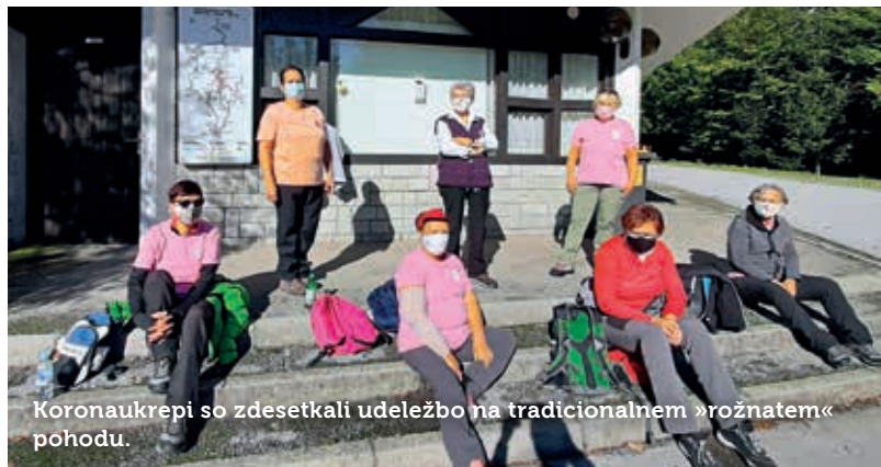
Koronaukrepi so zdesetkali udeležbo na tradicionalnem »rožnatem« pohodu.

Združenje Europa Donna Slovenija je tudi letošnji oktober »obarvalo« rožnato in ozaveščalo o pomenu zgodnjega odkrivanja raka na dojki. Prizadevne članice iz Postojne in Pivke so s tremi dogodki dodale svoj kamenček v vseslovenski mozaik ozaveščanja.