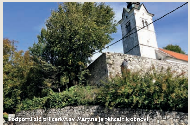
Podporni zid pri cerkvi sv. Martina je »klical« k obnovi.