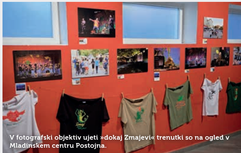
V fotografski objektiv ujeti »dokaj Zmajevi« trenutki so na ogled v Mladinskem centru Postojna.