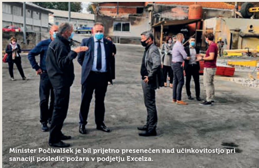
Minister Počivalšek je bil prijetno presenečen nad učinkovitostjo pri sanaciji posledic požara v podjetju Excelza.

Minister za gospodarstvo Zdravko Počivalšek se je po obisku v pivški občini, kjer se je 22. septembra mudil po izbruhu večjega števila okužb z boleznijo Covid 19, ustavil tudi v Postojni. Srečal se je s predstavniki občine ter pogo-relega podjetja Excelza in jim obljubil pomoč, obiskal pa je tudi Podjetniški inkubator Perspektiva v Velikem Otoku.