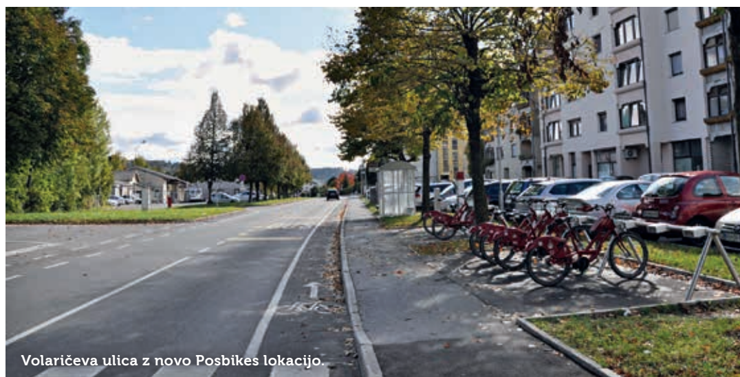
Volaričeva ulica z novo Posbikes lokacijo.