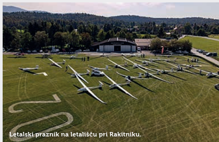
Letalski praznik na letališču pri Rakitniku.

Besedilo: Andrej Bratož; fotografija: Luka Hojnik.