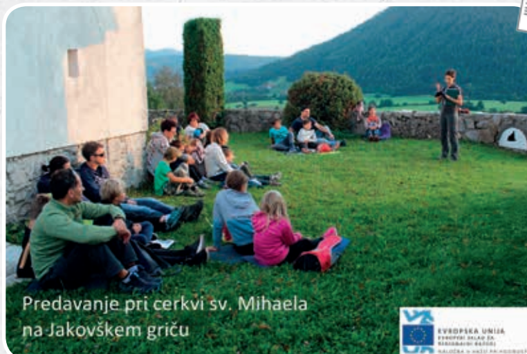
Predavanje pri cerkvi sv. Mihaela na Jakovškem griču

Dogodek smo zaključili z opazovanjem izletavanja netopirjev s cerkve sv. Mihaela. Za prisluškovanje netopirskim klicem smo si tudi letos pomagali s t. i. bat detektorji. Med čakanjem na prve netopirje smo organizatorji zbranim obiskovalcem predvajali posnetke oglašanja netopirjev. Kot bi netopirje s posnetki predramili iz njihovega prebivališča, so se začeli mali podkovnjaki eden za drugim spuščati s podstrehe cerkve.