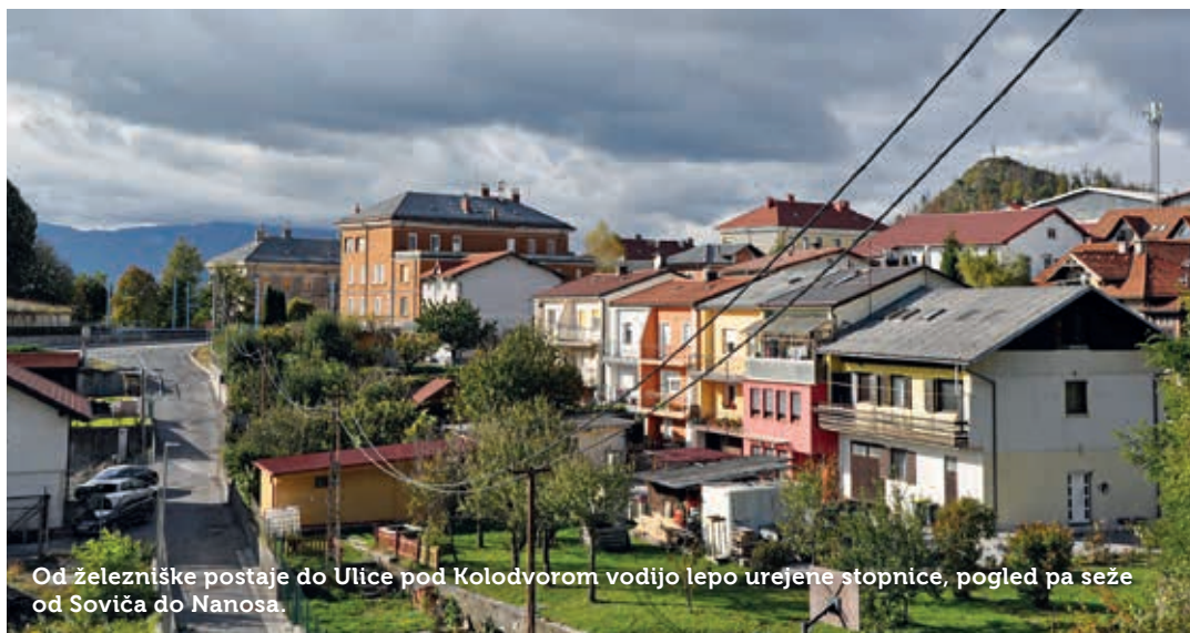
Od železniške postaje do Ulice pod Kolodvorom vodijo lepo urejene stopnice, pogled pa seže od Soviča do Nanosa.

V središču naselja v Stari vasi je KS postavila nov ekološki otok in središče prometno preure-