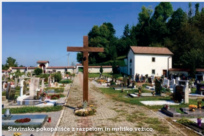
Slavinsko pokopališče z razpelom in mrliško vežico.

V odloku o pokopališki in pogrebni dejavnosti, ki je bil za območje občine Postojna sprejet sredi leta 2009, preberemo, da je znotraj občinskih meja urejenih šestnajst pokopališč. Za urejanje teh in pokopališko dejavnost na njih skrbi lokalna gospodarska javna služba, kjer te službe ni, pa je skrb za urejena mesta zadnjega počitka naložena krajevni skupnosti. Slednje velja tudi za pokopališče v Slavini, eno najstarejših in večjih v občini.