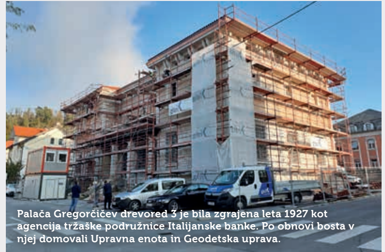
Palača Gregorčičev drevo-red 3 je bila zgrajena leta 1927 kot agencija tržaške podružnice Italijanske banke. Po obnovi bosta v njej domovali Upravna enota in Geodetska uprava.

S predstavniki Zavoda za varstvo kulturne dediščine (ZVKD) sodeluje investitor sicer že vse od začetka. Pri reševanju dodatnih tehničnih pro-blemov je bila projektantom v veli-ko pomoč dokumentacija iz zgo-dovinskega arhiva v Rimu, čeprav bi si želeli, da bi jim bila ta na voljo že na začetku. Tako bi bilo mogoče, kot navajajo, marsikaj predvideti, in obseg dodatnih in spremenjenih del bi bil zagotovo manjši. Po besedah Beligarjeve so pri izdaji kulturno-