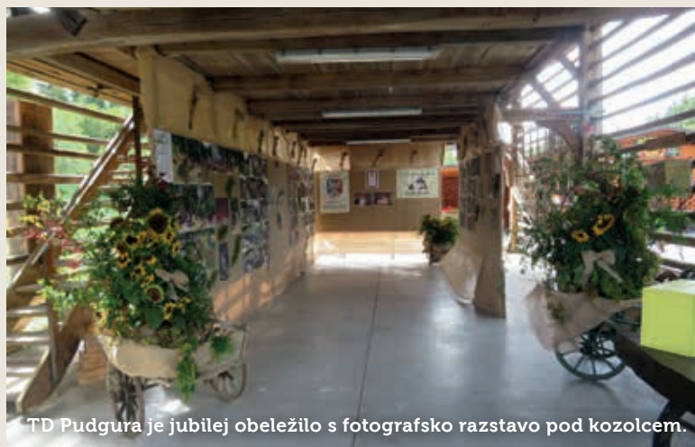
TD Pudgura je jubilej obeležilo s fotografsko razstavo pod kozolcem.